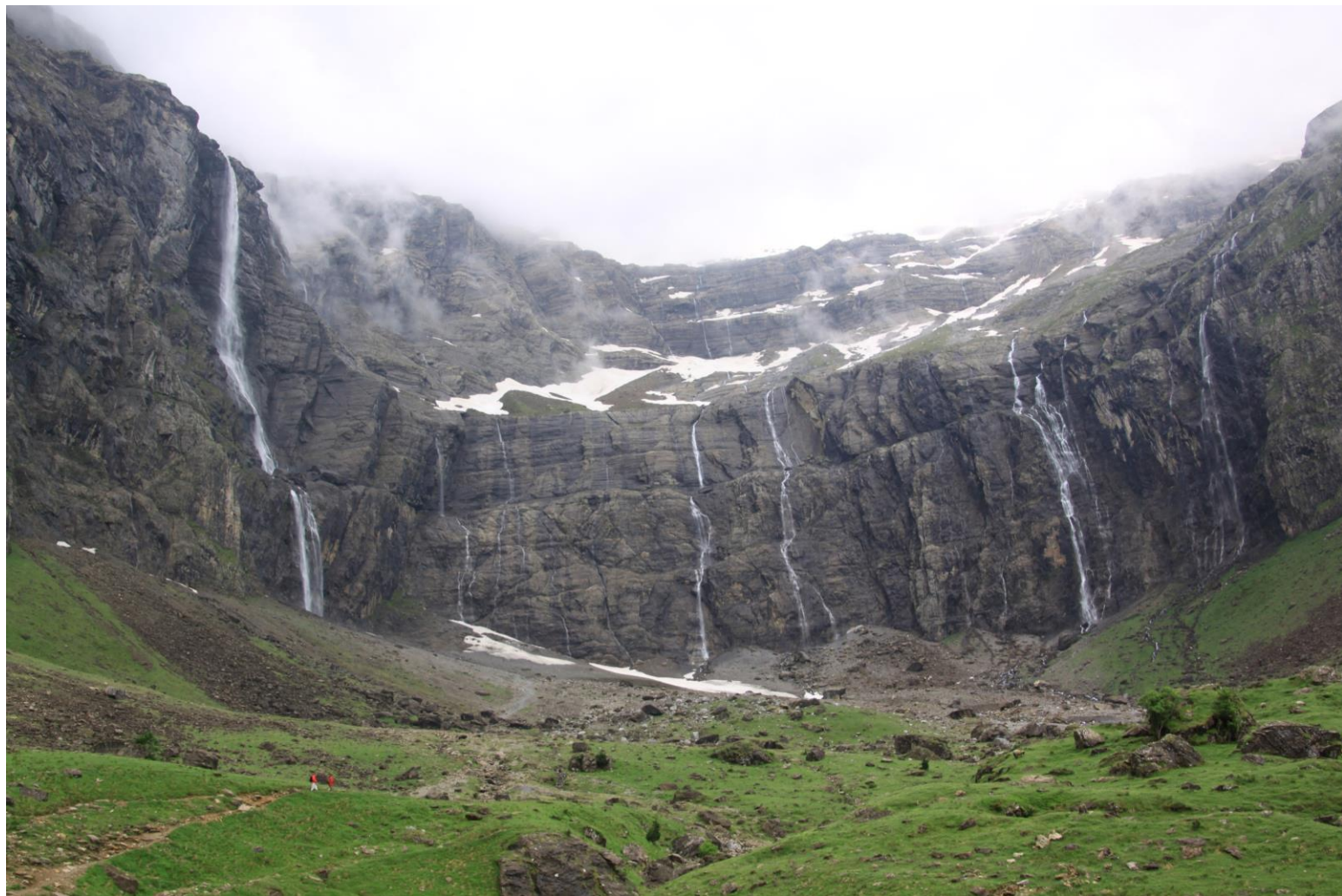
ガヴァルニー大圏谷

ガヴァルニー大圏谷はピレネーとして世界複合遺産に登録されている。10万年かけて氷河が山を削り作り上げた奇跡の大圏谷であり、自然の円形大劇場である。