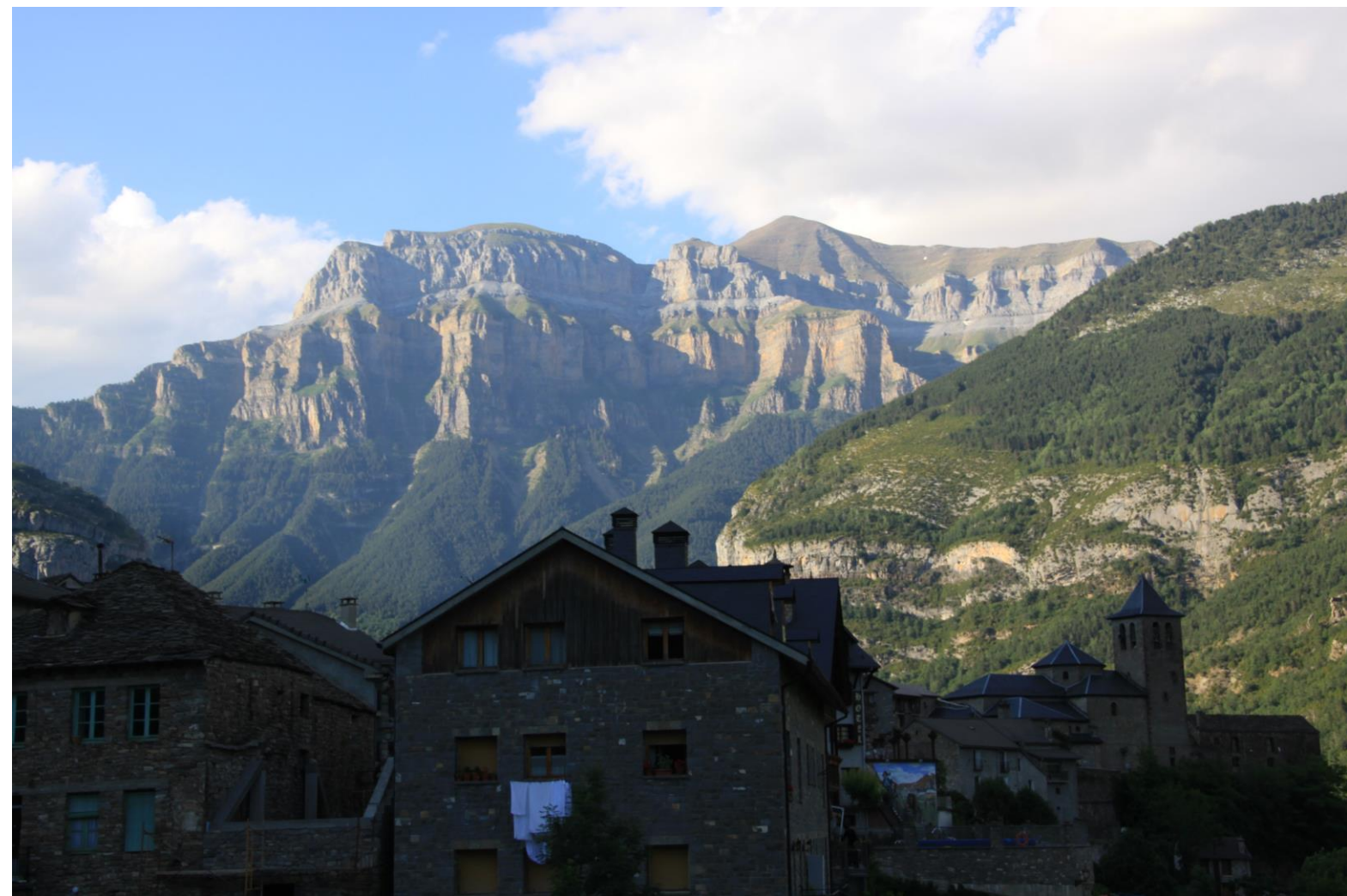
トレラ村から見るオルデサ渓谷の山々

オルデサ・ペルディート国立公園拠点のトルラ村では石造りの家並みから、スペイン側ピレネーの山々（ドバコール）がよく見える。